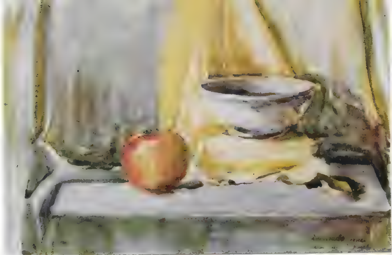
Natuurmort - Aquarell